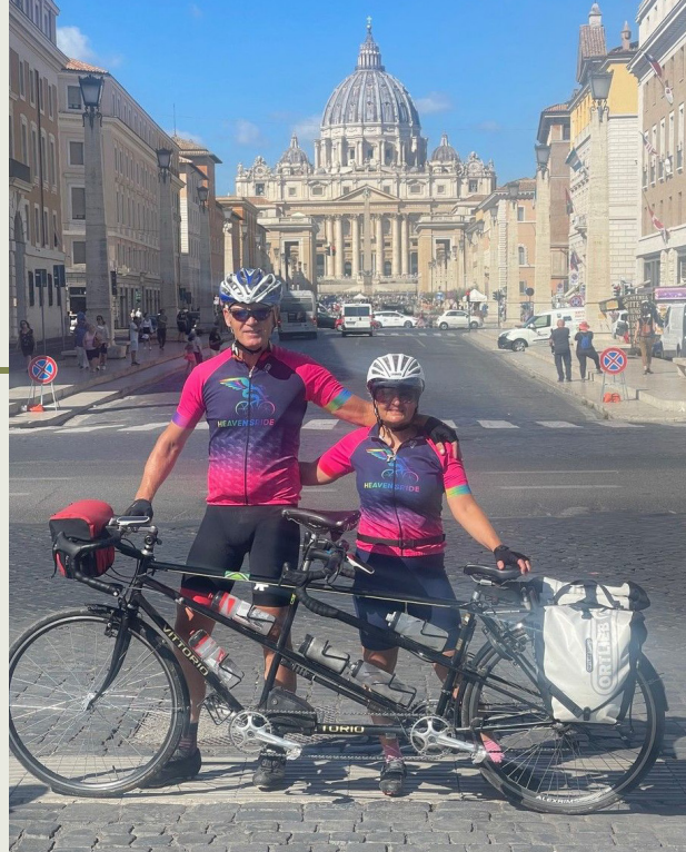
De vrijgekomen tijd wordt besteed aan tandemfietsvakanties door Europa.

"Dat er actief wordt ingespeeld op vragen vanuit de samenleving.