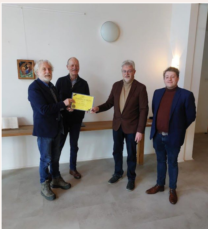
Overhandiging van een bon met een waarde van € 2000,-, geschonken door de loge Karel van Zweden (de orde van Vrijmetselaren in Zutphen).

Wanneer een stuk niet geschikt blijkt voor veiling, dan zullen wij het via Marktplaats trachten te verkopen. Lukt dit niet binnen afzienbare tijd, dan schenken wij het in het uiterste geval aan de kringloop.